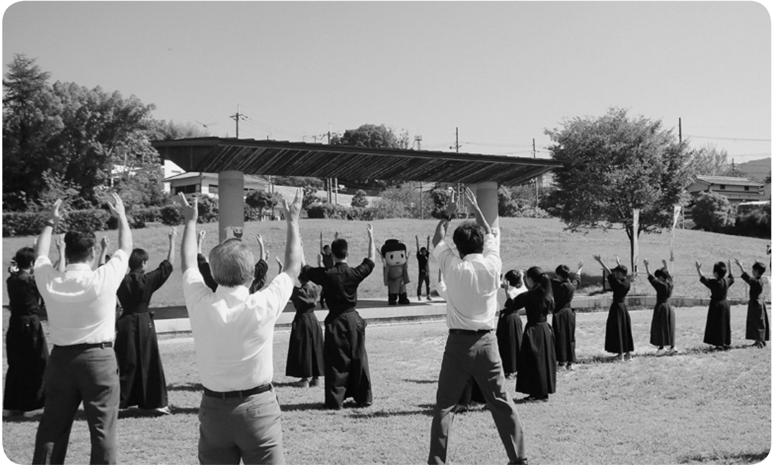
▲9月15日(日) たいし聖徳市