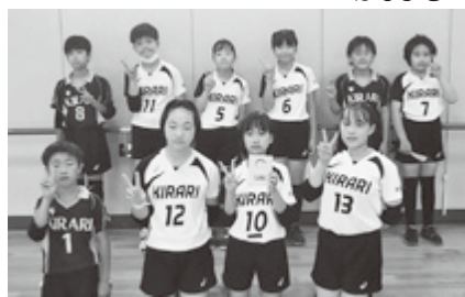
◆城南カップ 太子キラリ 準優勝