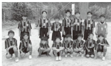
◆太子カップ2022 6年生の部 準優勝 太子町ジュニアサッカークラブ