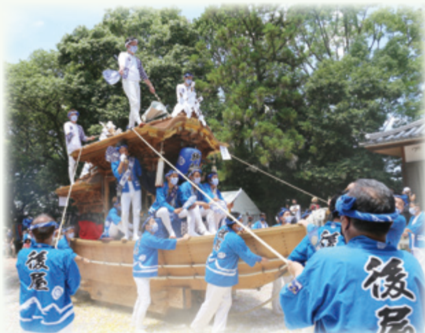
▲7月24日(日)科長神社の夏祭り 本宮