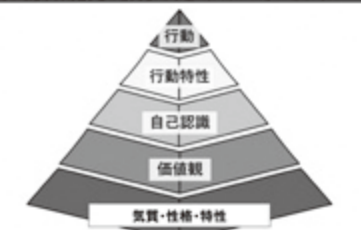
非認知能力育成のためのピラミッド