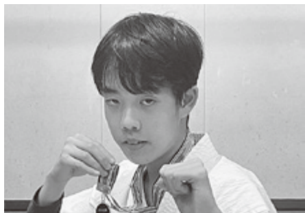
◆MA日本キックボクシング連盟 啓道館主催 第27回オープンワンマッチ格闘技大会