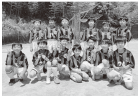
◆太子スプリング杯2023