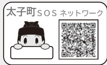
見守りシール見本▲