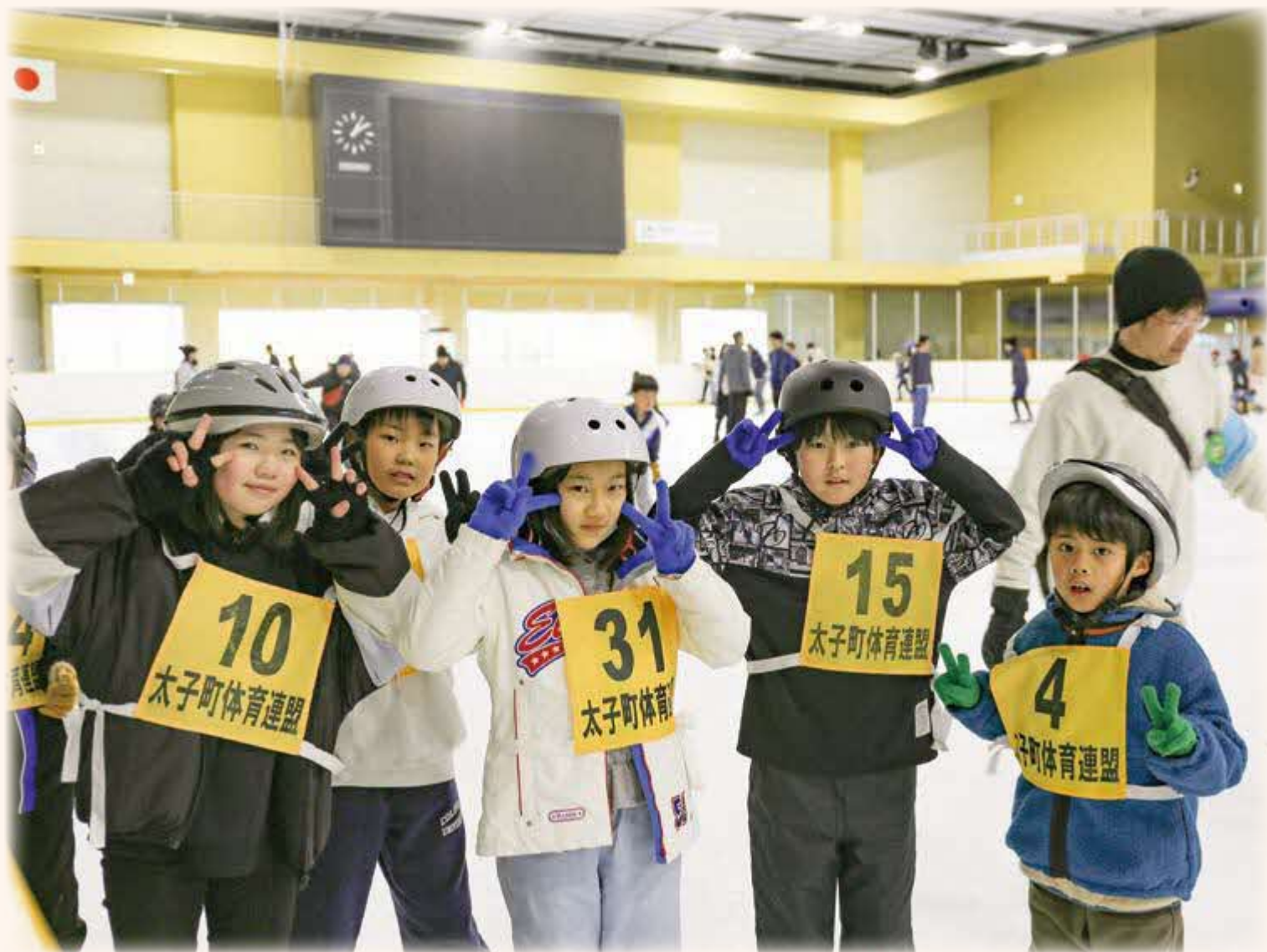
▲2月11日(日) アイススケート教室