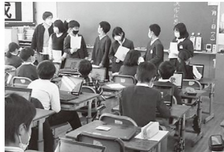
発表の様子 児童の作品▶