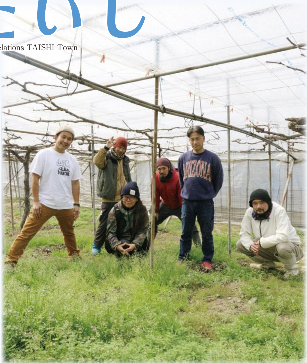
▲2月10日(金) 太子町ぶどう新規就農者の皆さん