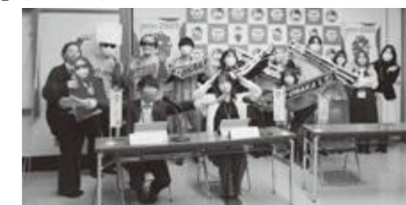
▲2月8日(水)配信の様子

太子TVは、毎月、おおむね第2水曜日午後6時～生配信中! 町の情報や魅力を発信しています。みなさまぜひ、ご覧ください。