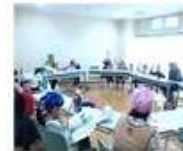
5. お昼ご飯「目たくさん味噌汁、おにぎり」