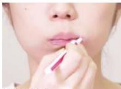
口閉じ歯磨き

コロナ禍の中ウイルス感染は、鼻や口、目の粘膜などから起こります。口の中が不潔だと、口の中に潜む歯周病菌などの細菌がタンパク分解酵素をつくり出し、ウイルスが粘膜細胞へ感染するのを助けてしまいます。誰もができる歯磨きなどのケアは、感染症対策の第一歩です。職場や学校などでの昼食後の歯磨きも、実は、「今こそ必要」だということです。そして身につけたいのが唾液飛沫の飛散を防ぐ「口閉じ歯磨き」です。前歯の外側を磨く際に、歯ブラシが隠れない場合は、お口をすぼめてブラシ部分を覆うようにしましょう、ウィズコロナのニューノーマル時代。適切なケアを習慣にして口と体の健康を保ちましょう。