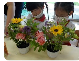
フラワーアレンジメント