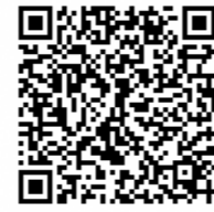
▲事前公開用ページ