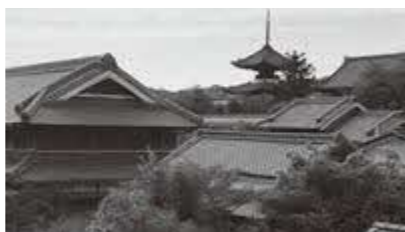
叡福寺前山本家住宅（庭側から撮影）

答 大正時代の建築で、国の登録有形文化財の山本家住宅は、町へ寄付の申し出があり、関係4部局で、対応協議中。（※田中家についてはP1参照）