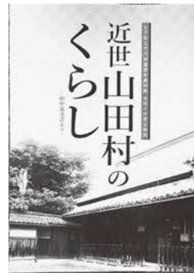
太子町立竹内街道歴史資料館令和4年度企画展図録