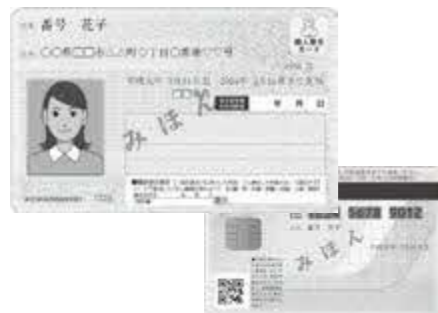
マイナンバーカード（見本）

【専決処分 理由】マイナンバーカードの取得促進事業及び子育て世帯生活支援特別給付金給付事業として、早急な対応が必要な経費について一般会計補正予算（第2号）を編成し、地方自治法第179条第1項の規定に基づき、4月26日に専決処分を行った。