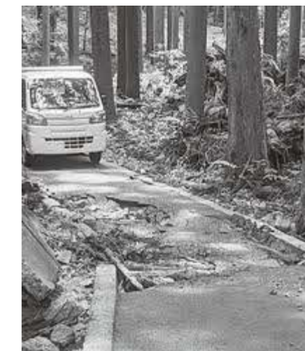
町道南今池線路面損傷