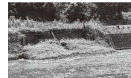
町道御陵道線路肩崩壊