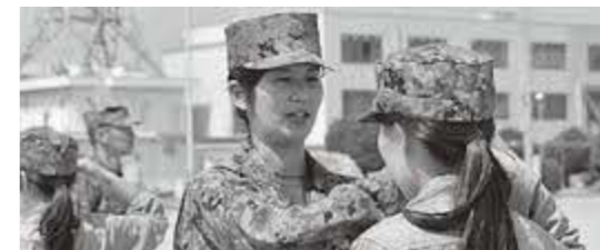
自衛官募集 (防衛省HPより抜粋)

答 自衛官等募集事務については、「自衛隊法」97条第1項に基づく市町村の法定受託事務と定められており、これに係る経費については、国庫支出金により負担されている。本町においても庁舎における自衛官募集広報ポスター等の設置や、広報紙への掲載、役場正面の懸垂幕の設置などを行っている。自衛官、自衛官候補生の募集に関し必要となる個人情報の提供だが「自衛隊法施行令」第120条には、「防衛大臣は、自衛官又は自衛官候補生の募集に関し必要があると認めるときは、都道府県知事又は市町村に対し、必要な報告又は資料の提出を求めることができる。」とされている。今後も個人情報の観点から法令を遵守し、業務を遂行していく。