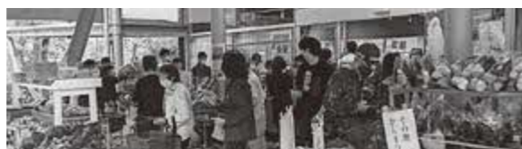
運営状況が向上 賑わう道の駅

町としても、道の駅の来訪者増加に向け引き続き取り組むとともに、南河内フルーツロードの「北の玄関口」を目指して、地域の活性化や利便性向上につながるよう検討を深めていく。