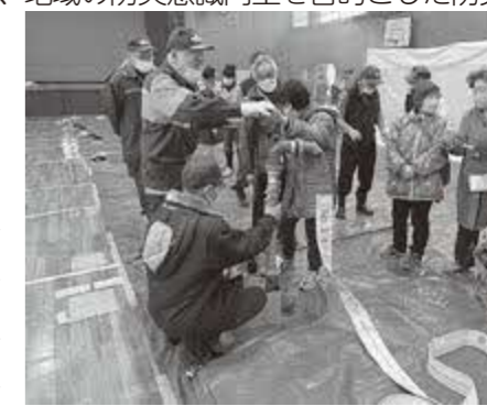
2月19日開催防災訓練風景

答 自助のサポート事例としては、ハザードマップによる災害に対する備えの情報提供や町公式LINEによるマイタイムラインの作成支援、広報紙や防災行政無線による周知、国等と連携したJアラート訓練、太子TVでの防災情報の紹介などを行っている。また、小学校の防災の授業に職員が出向き、防災への備えなどについて説明を行う事で、子どもたちが自助の大切さについて理解を深め、子どもから保護者へと伝わり広がるよう取り組んでいる。自助は、災害時において最も基本的で重要であり、今後も啓発やサポートを継続的に行っていく。消防団の地域防災活動の取り組みとして今年2月下旬から3月上旬までの3週間にわたる毎週日曜日には消防団などの主催により、地域の防災意識向上を目的とした防災訓練を行った。