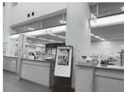
マイナンバー窓口