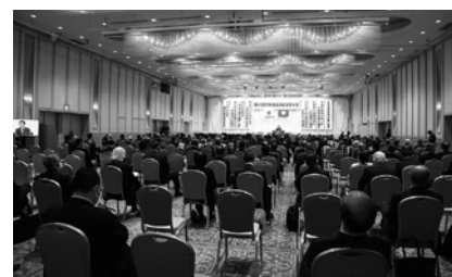
全国から集まった町村議会議長会役員 (明治記念館)

私は「令和4年度の国の予算案の決定に向けて、新型コロナウイルス感染症対策をはじめ、深刻化している議員のなり手不足などの諸課題に対する環境整備、災害からの復旧支援や災害対策の確立、まち・ひと・しごと創生事業費1兆円の継続と拡充、デジタル化社会や脱炭