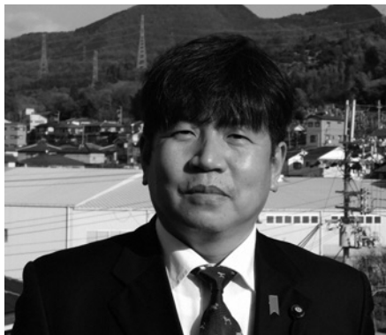
議長 (第47代) 辻本 馨