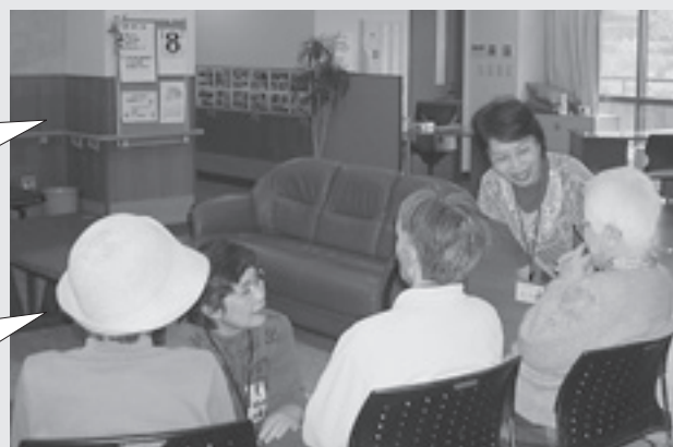
▲施設訪問活動の様子

介護される人ではなく、人と人の繋がりで楽しくお話をさせて頂いてます。 “今日の出会いを・・・あなたも一緒にしてみませんか”