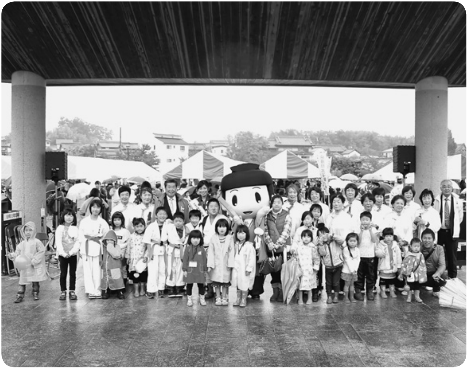
▲11月9日(日) ふれあいTAISHI 2014・たいし聖徳市