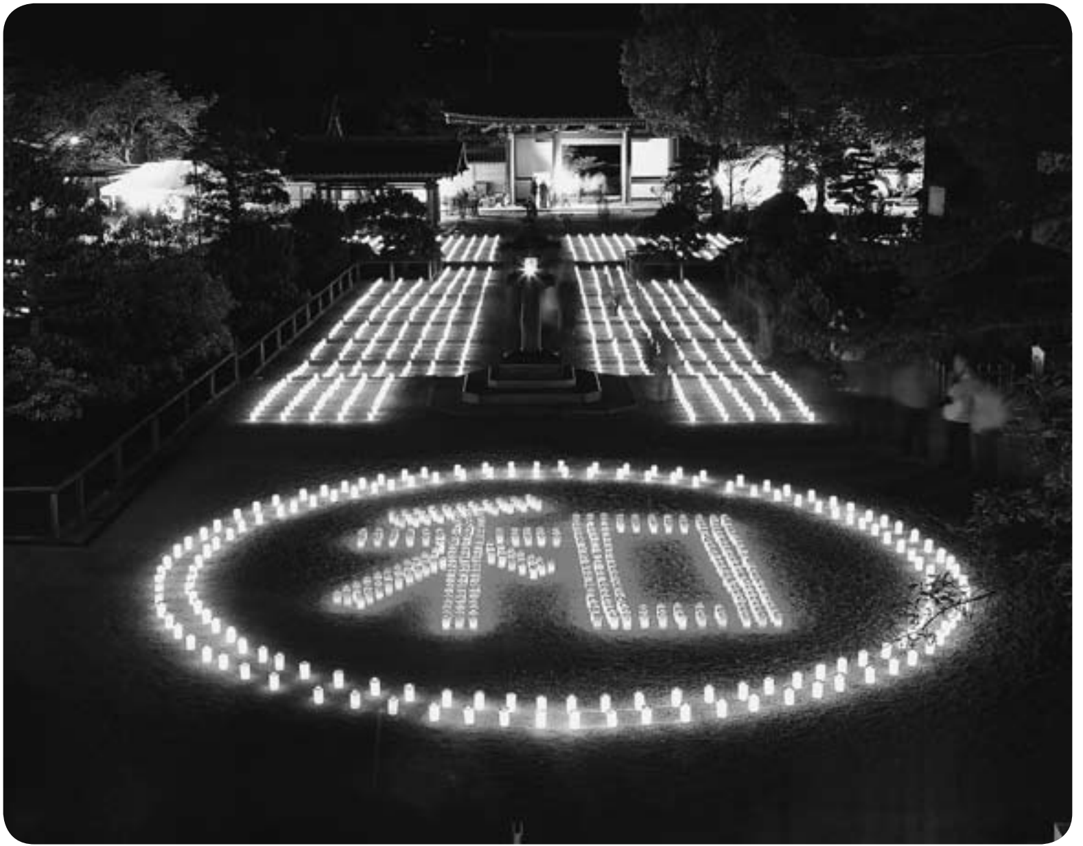
▲ 4月20日(土)、21日(日) 太子聖燈会