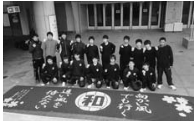
◆近畿中学生バレーボール選抜 優勝大会 ベスト8 太子中男子バレーボール部