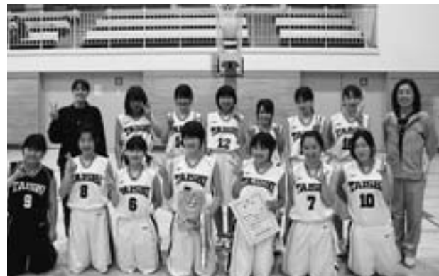
◆南河内地区春季大会 準優勝 太子中女子バスケットボール部