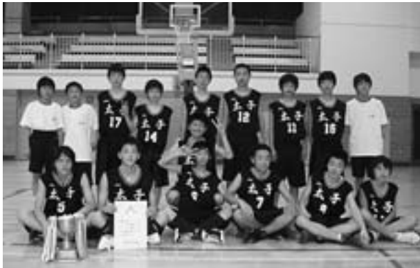
◆南河内地区春季大会 優勝 太子中男子バスケットボール部