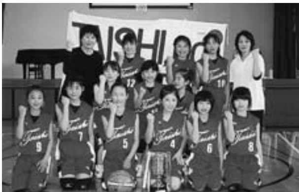
◆天理西カップ 優勝 ◆南河内大会新人戦 第3位 太子女子ミニバスケットボールクラブ