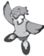
大阪府広報担当 副知事もずやん