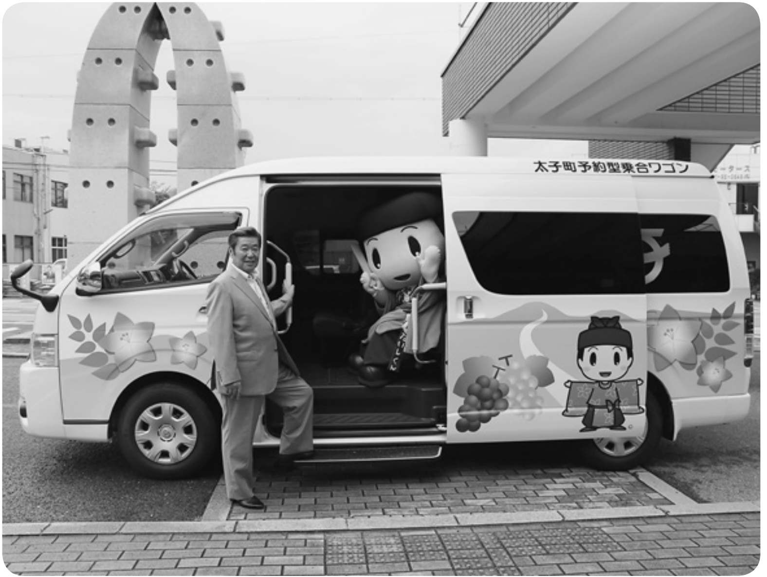
▲たいしくん外出支援号(新車両)