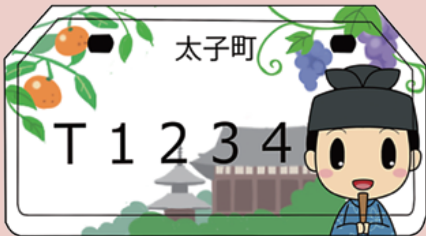
【「たいしくん」ナンバープレート決定デザイン】