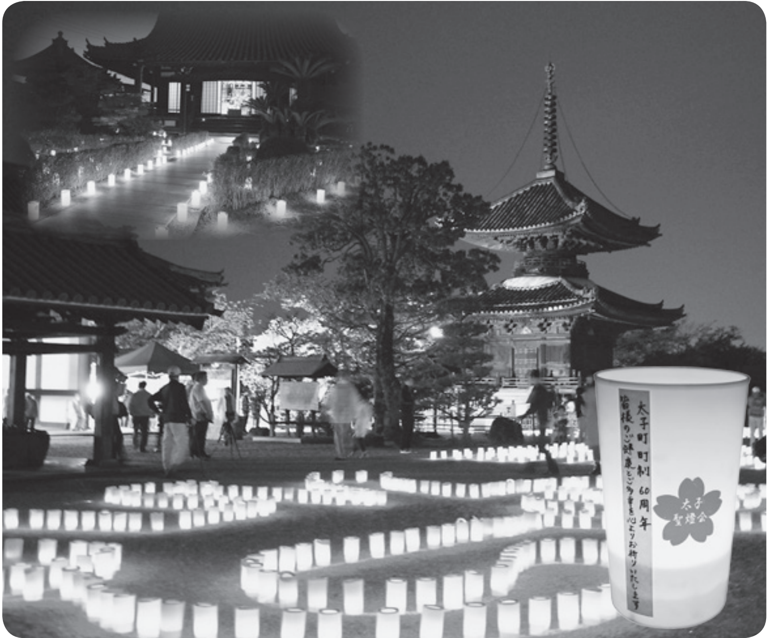
▲ 4月23日(土)・24日(日) 太子聖燈会