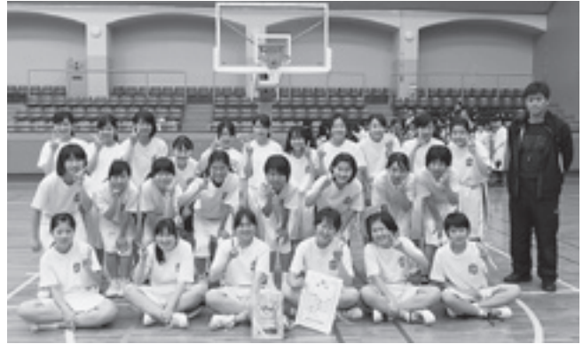
◆南河内地区春季大会 準優勝 太子中女子バスケットボール部