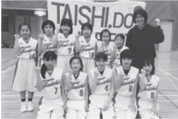
◆SAKAWAウィンタリーグ 第2位 河南カッブ 第4位 太子ミニバスケットボールクラブ