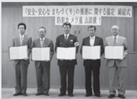
◆問合せ 安全環境グループ ☎98-5525