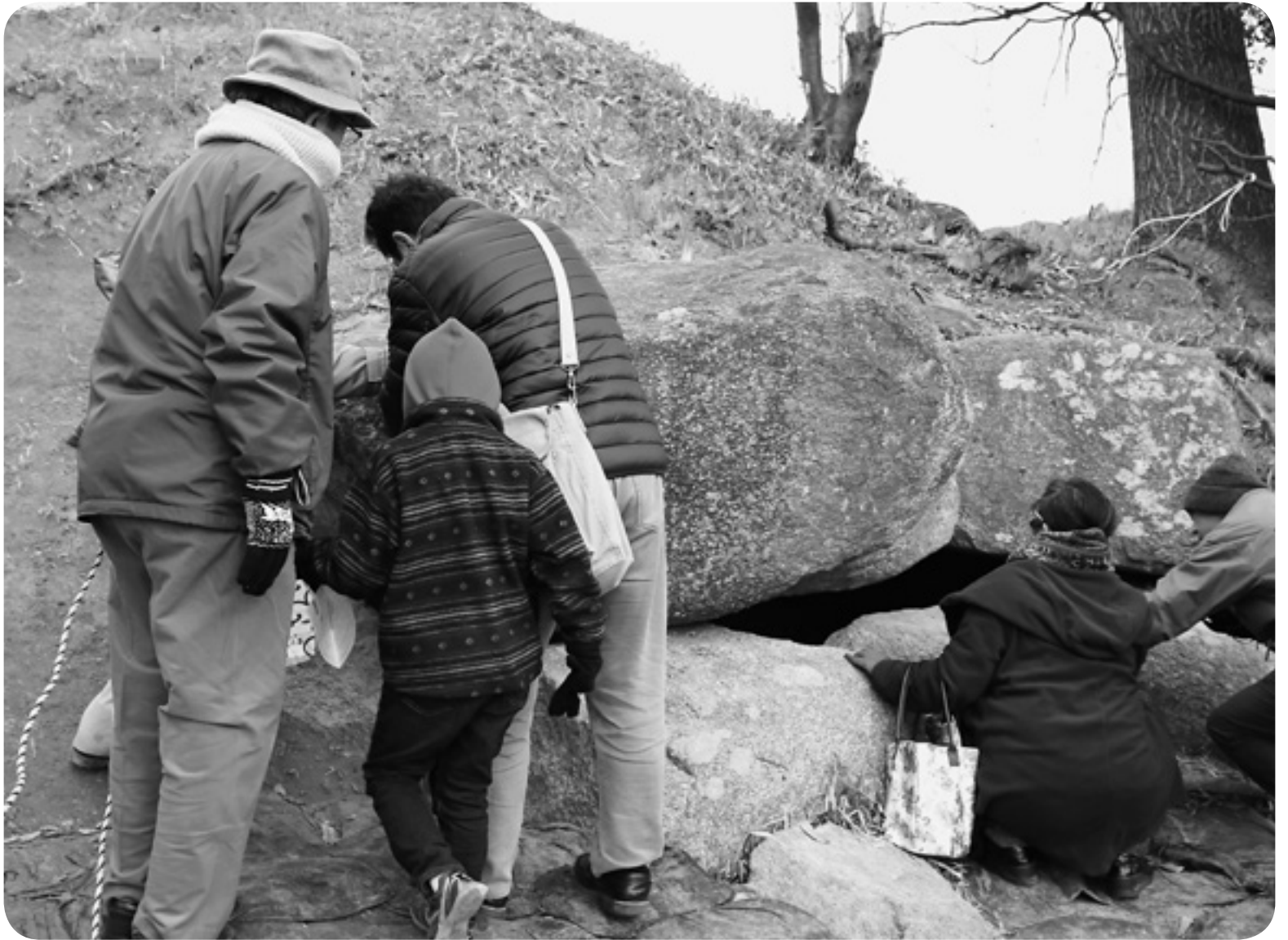
▲ 2月11日(土・祝) 二子塚古墳発掘調査現地見学会の様子