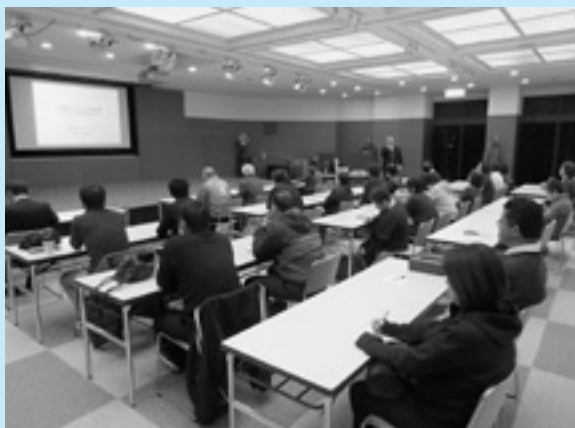
◀12月9日(金) 人材育成研修