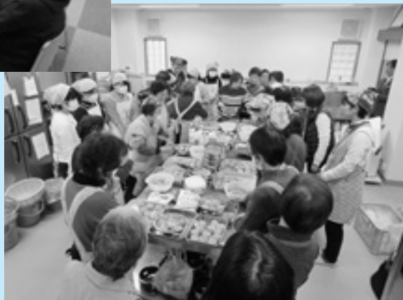
1月21日(土) 特産品開発研修▶