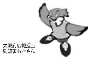
大阪府広報担当 副知事もずん