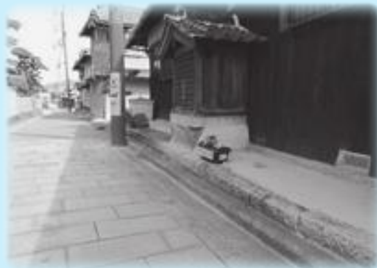
竹内街道と石畳(太子町)

次号から沿道10市町村ごとの現地案内人による「竹内街道・横大路(大道)」のおススメピックアップを連載していきます。沿道のちょっと気になる観光ポイント、案内人だからこそ知っている話題など…を取り上げます。1400年の歴史を持つ竹内街道の今を旅しましょう。ご期待ください。