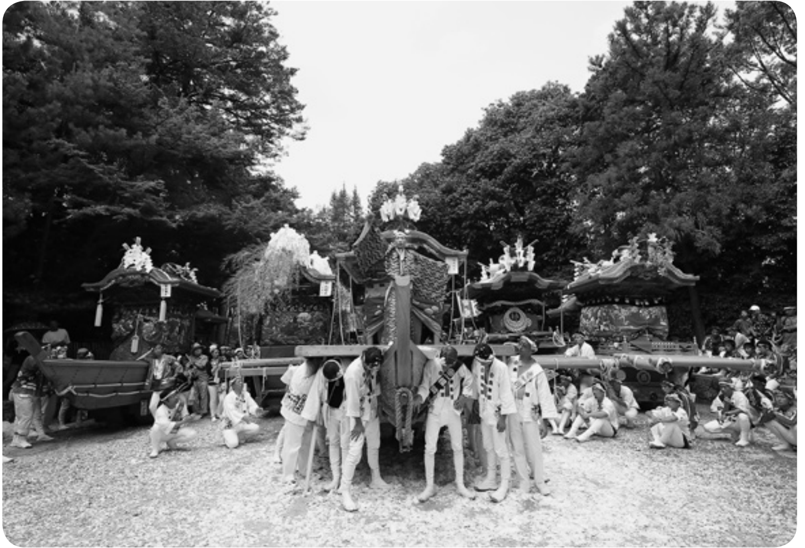
▲ 7月30日(日) 科長神社の夏祭り 神事三番叟