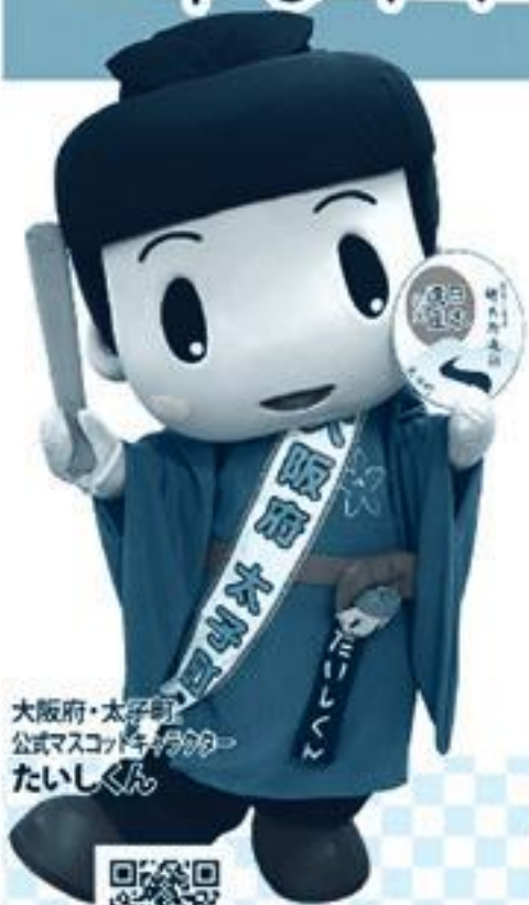
大阪府・太子町 公式マスコットキャラクター たいしくん