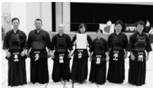
◆第71回大阪府総合体育大会中央大会 剣道の部 第3位 太子町聖徳館