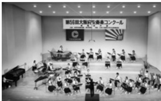
◆大阪府吹奏楽コンクール 南地区大会 金賞 太子中 吹奏楽部