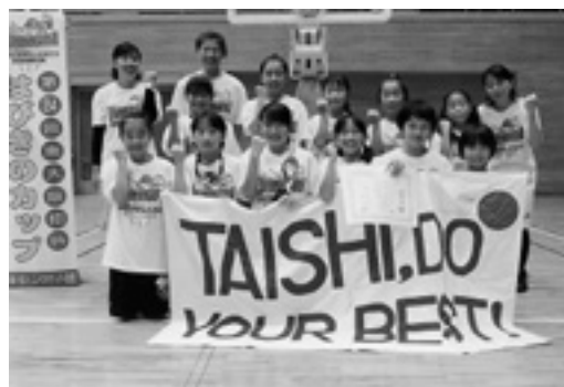
◆第24回南大阪招待はびきのカップ 下位トーナメント 2位 太子ミニバスケットボールクラブ