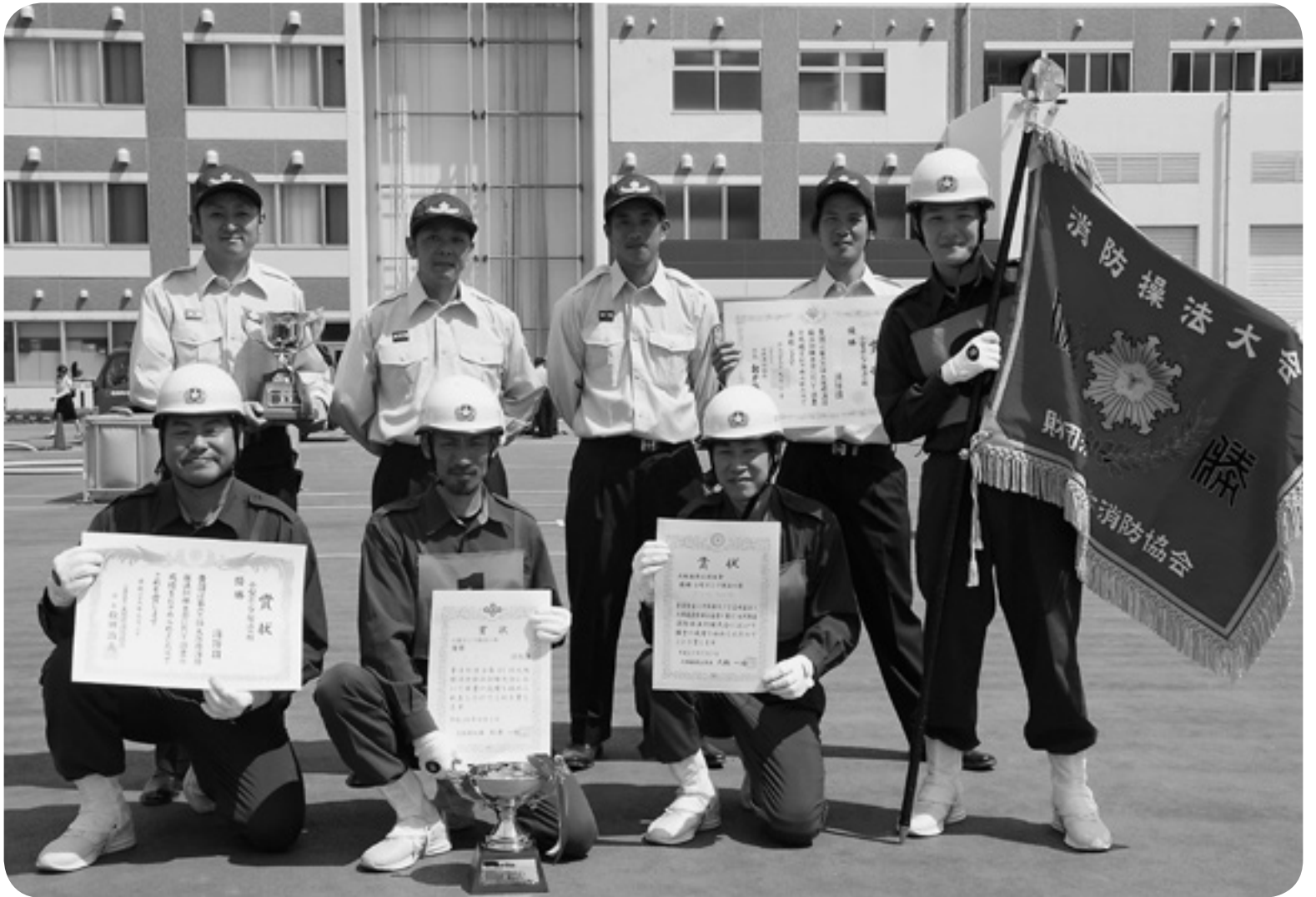
▲ 9月3日(日) 太子町消防団が大阪府消防操法訓練大会で優勝