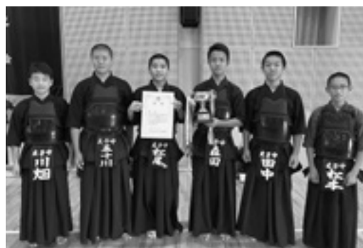
◆南河内地区総合体育大会 男子団体 優勝 太子中 剣道部