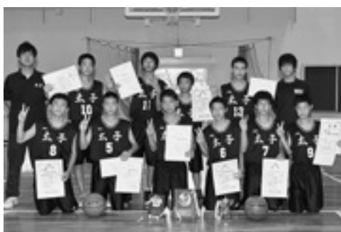
◆南河内地区総合体育大会 第3位 太子中 男子バスケットボール部