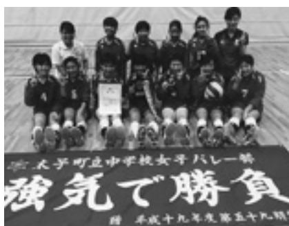
◆南河内地区総合体育大会 準優勝 太子中 女子バレーボール部