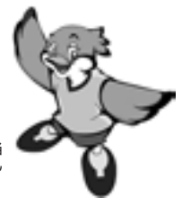
大阪府広報担当 副知事もずやん