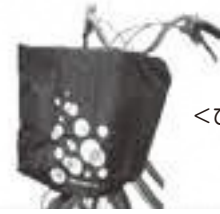
<ひったくり防止カバー>