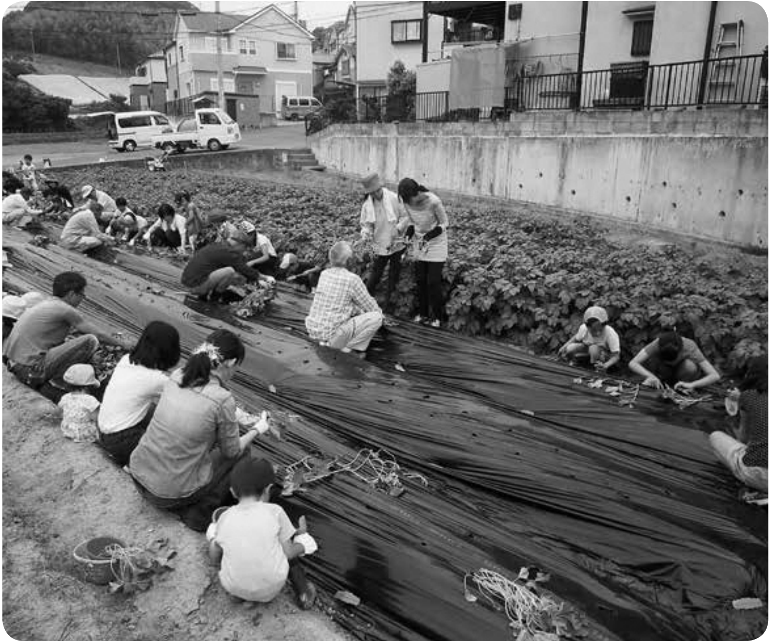
▲5月26日(土) わくわく農業体験