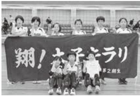
◆全日本バレーボール小学生大会 阪南支部予選大会 女子ブロック優勝 太子キラリAチーム