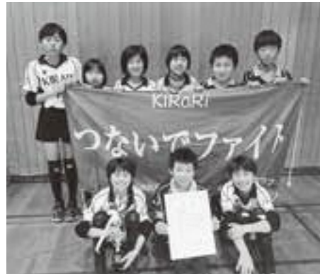
◆全日本バレーボール小学生大会 阪南支部予選大会 混合ブロック準優勝 太子キラリMチーム

◆平成30年度 のじぎく杯 西日本障害者ビームライフル 射撃大会 ビームライフル射撃 40発競技SH1 第1位 東宏