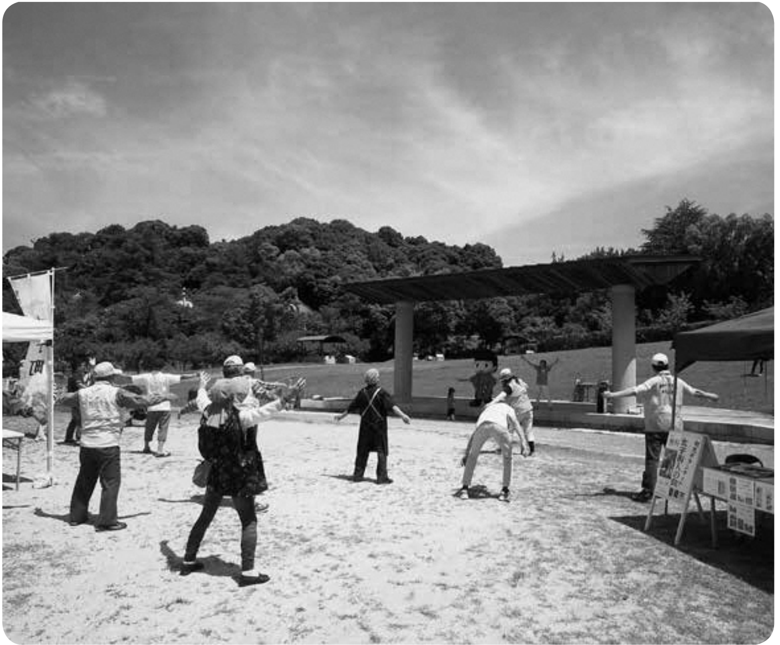
▲6月17日(日) ミニ健康展 in 聖徳市