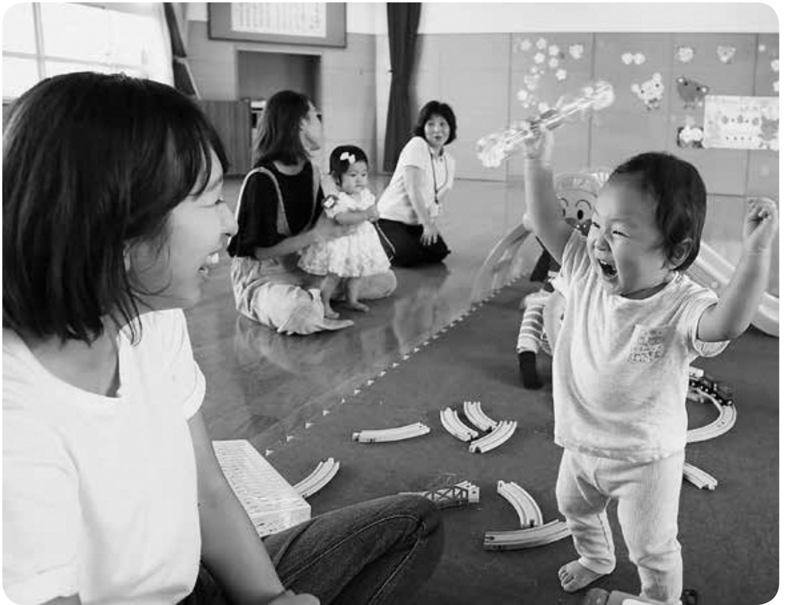
▲ 9月14日(金) おひさまひろば「ぷらす」