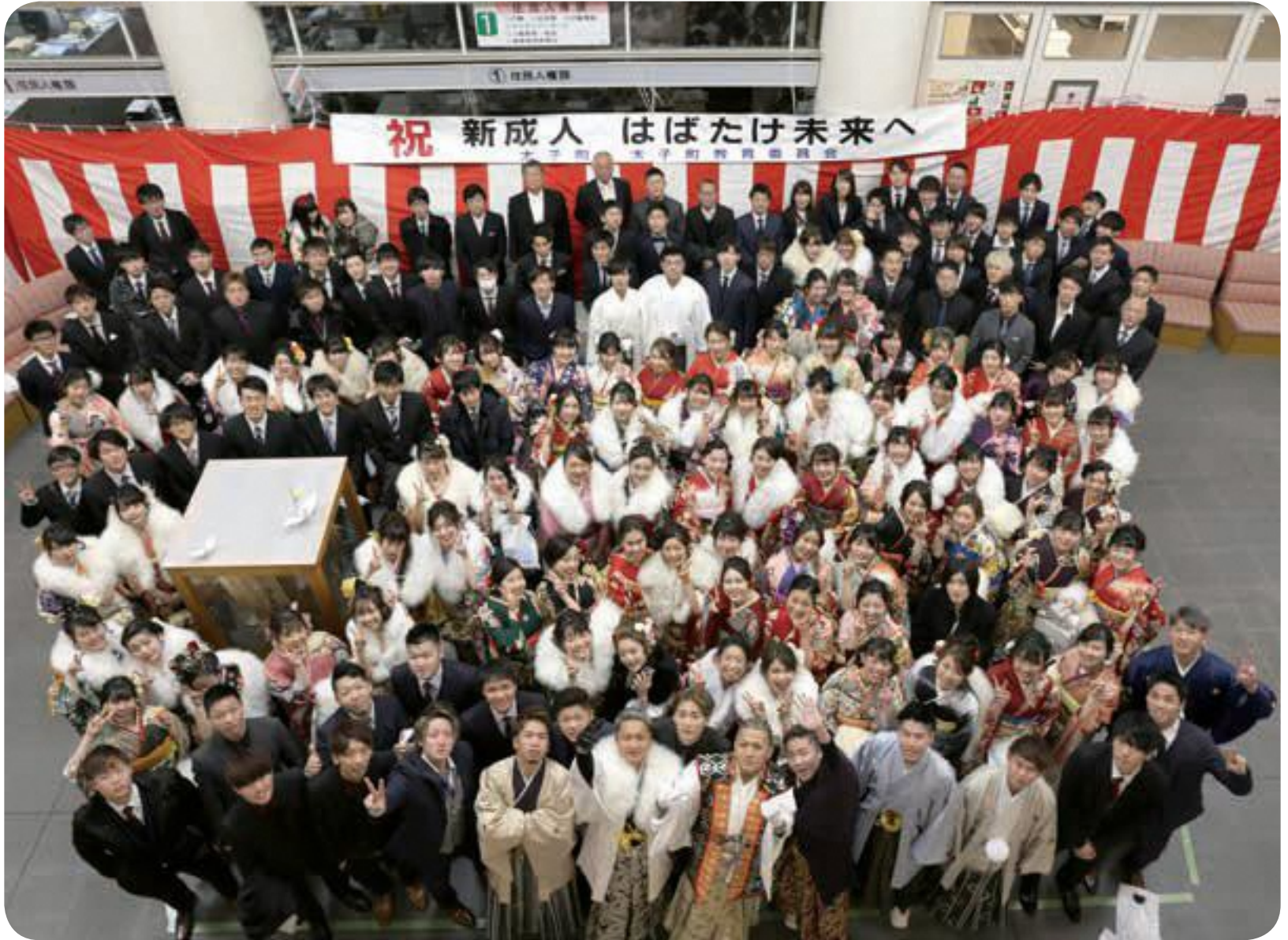
▲ 1月14日(月・祝) 太子町成人式