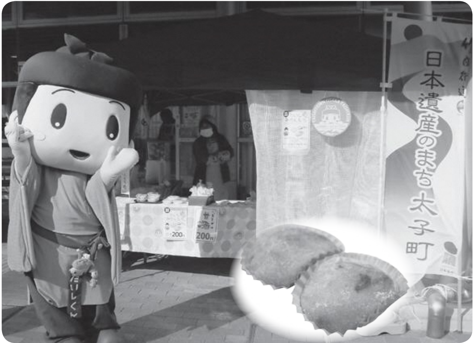
▲ 2月10日(日) 道の駅近つ飛鳥の里・太子でみかんもちを販売しました