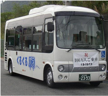
▲ くるくるバス