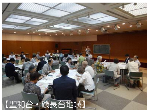
【聖和台・磯長台地域】