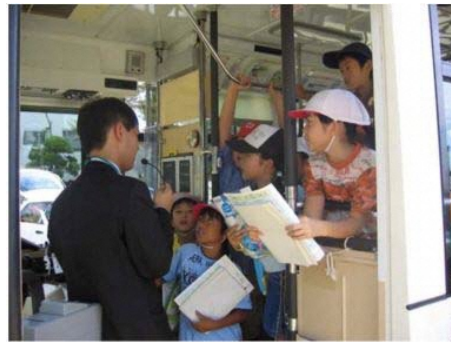
阪急バス株式会社さんの説明に興味津々