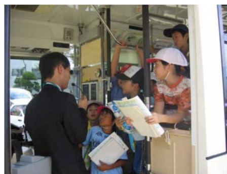
阪急バス株式会社さんの説明に興味津々