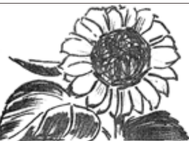
終戦の日「ひまわり」は全開だった

時が流れ、一九六四（昭和三九）年、日本でオリンピックが開催され、平和が謳歌されていた頃でした。松阪市が、平和への願いを込めて、戦没兵士の手紙や遺稿を募集する広報を出しました。