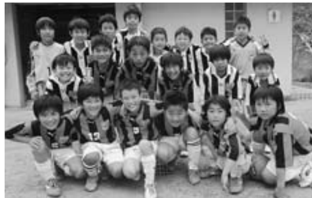
◆太子スプリング杯2012 小学4年生の部 優勝 太子町ジュニアサッカークラブ