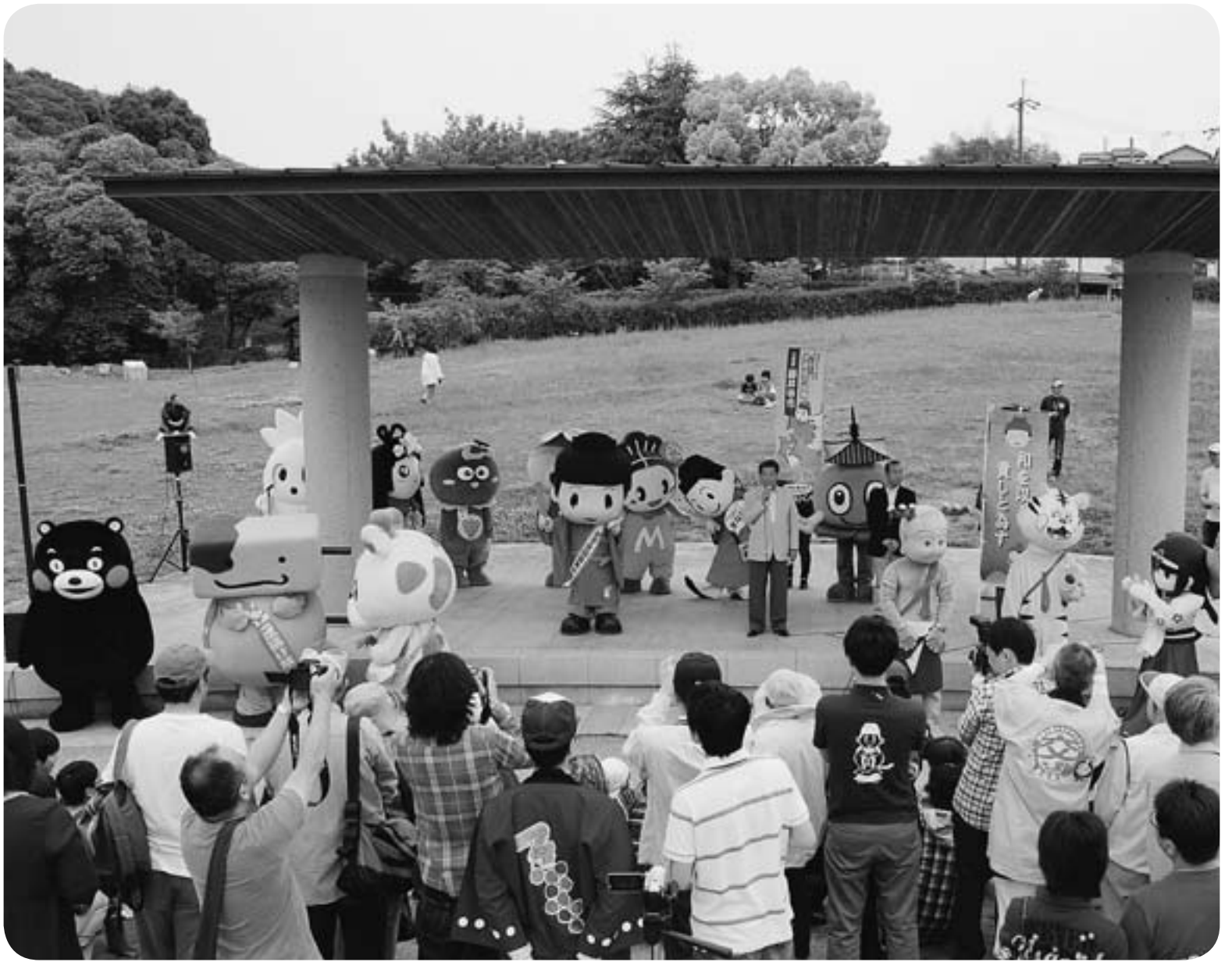
▲ 5月20日(日)、たいしキャラ日和2012