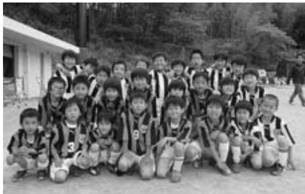
◆太子スプリング杯2012 小学2年生の部 準優勝 太子町ジュニアサッカークラブ