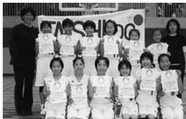
◆南河内バスケットボール大会 新人選 女子の部 優勝 太子ミニバスケットボールクラブ