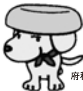
府税のキャラクター “タッピー”