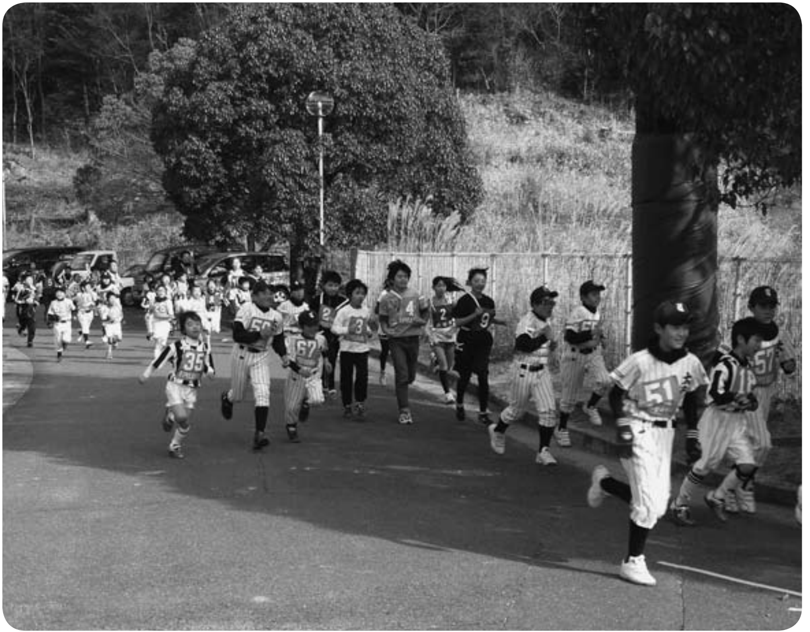
▲ 1月20日(日)、新春ジョギング大会