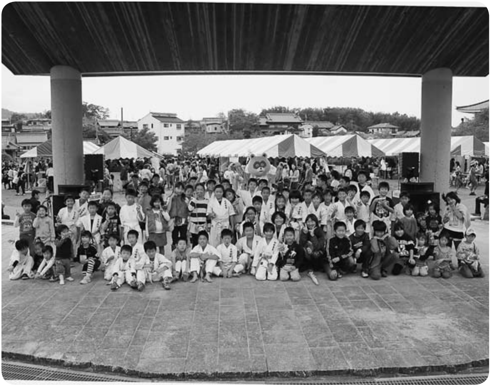
▲11月10日(日) ふれあい TAISHI 2013・たいし聖徳市