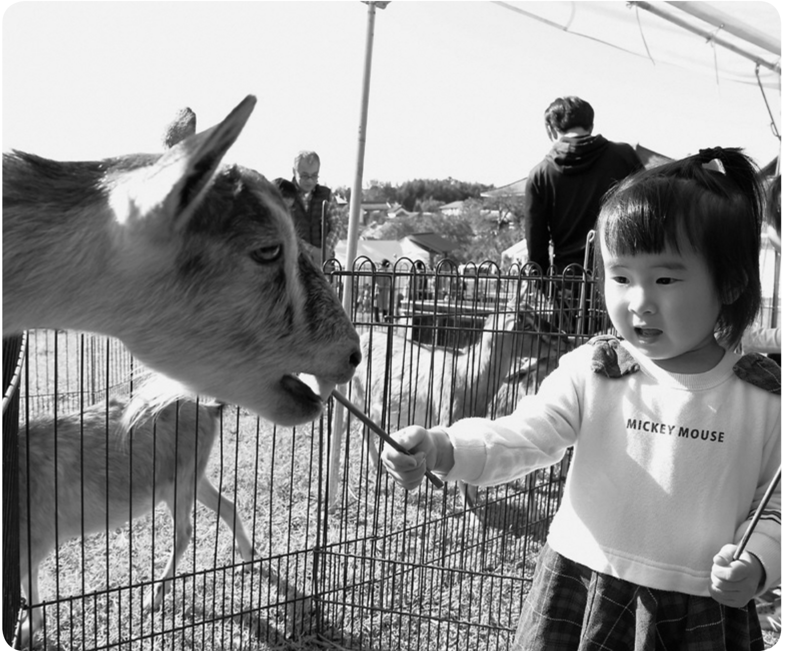
▲11月10日(日) ふれあい TAISHI2019