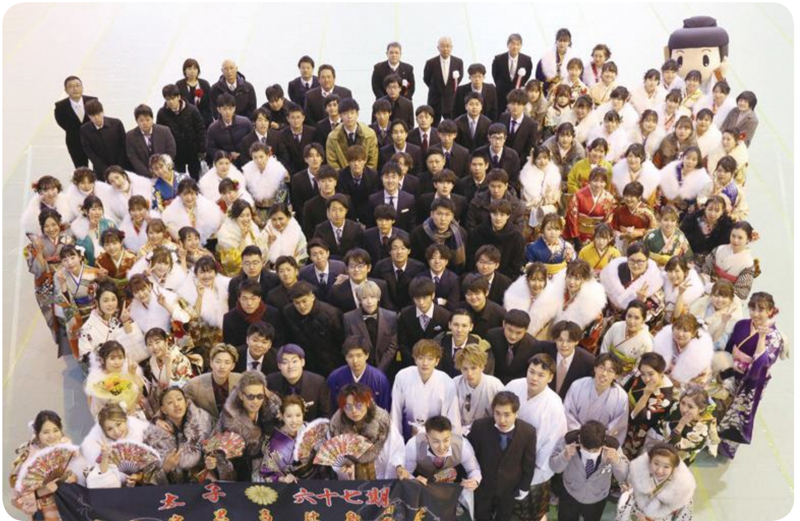
▲1月11日(月・祝)太子町成人式