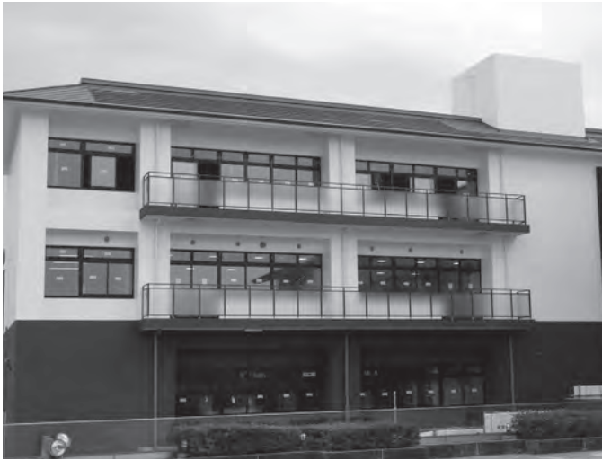
▲完成間近の太子の森

令和4年7月の開館予定の太子町立生涯学習センターを、より多くの人に親しみを持ってもらえるように、愛称を募集しました。応募頂いた90作品から、選考委員により4作品に絞り、2月1日(火)～25日(金)の期間に、住民による投票を行った結果、愛称が決定しました。たくさんのご応募、ご投票ありがとうございました。