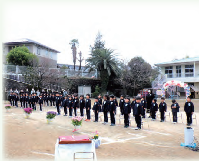
▲各幼稚園、保育園卒業式・町立小学校、中学校卒業式