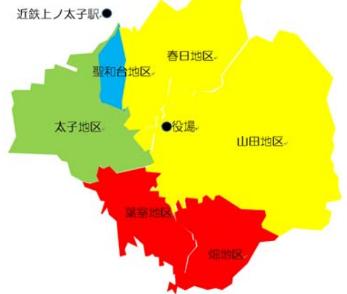
【地区別 空家等の分布】